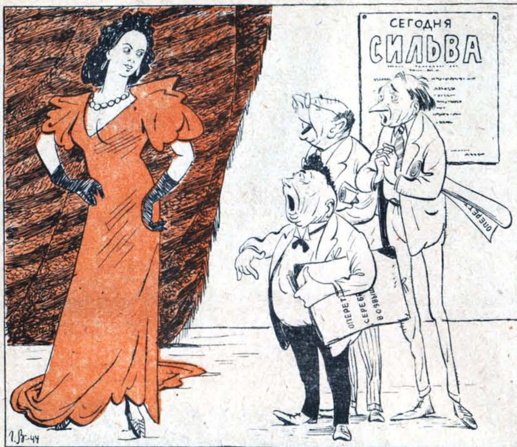
АВТОРЫ НОВЫХ ОПЕРЕТТ: — Сильва, ты меня погубишь!..