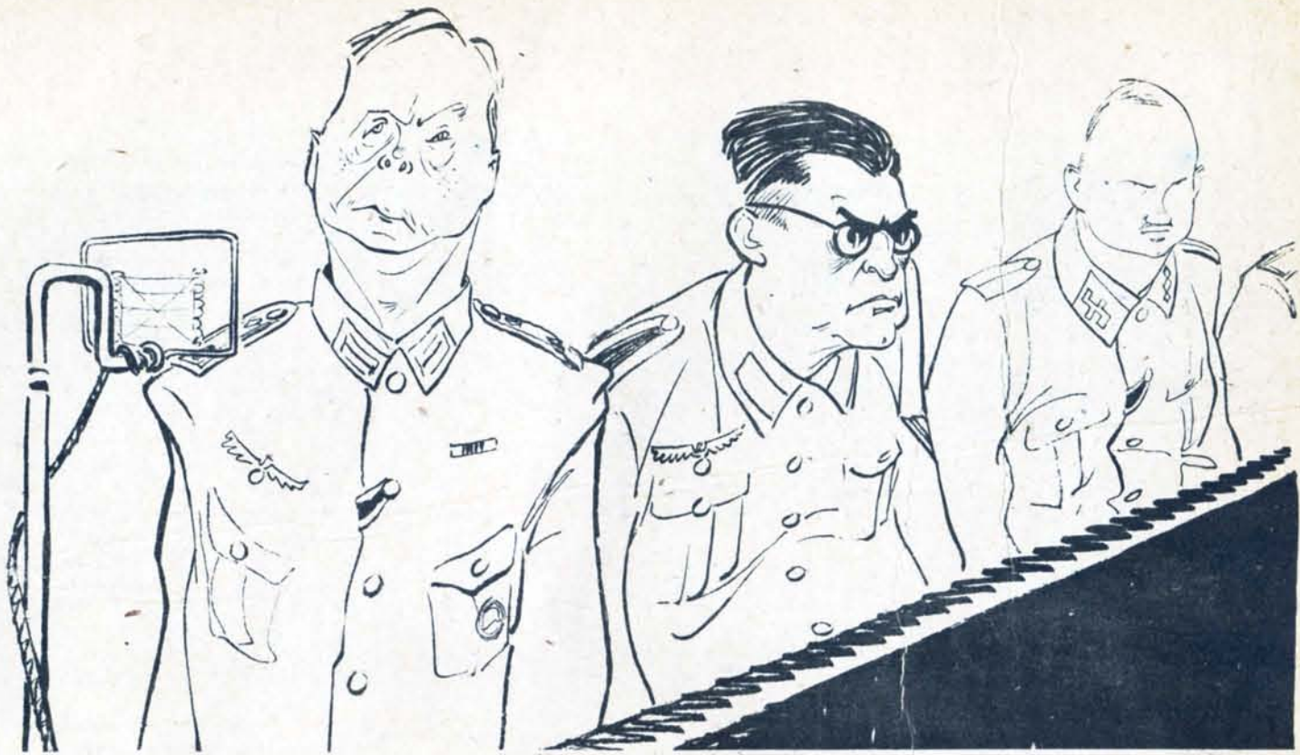
Продолжение скамьи подсудимых следует...