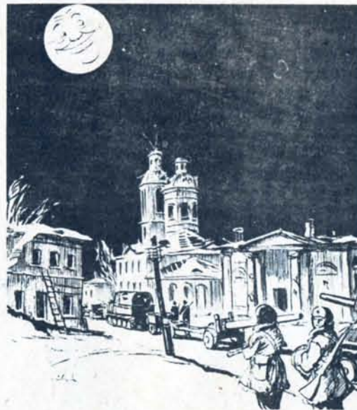
Рис. И. Семёнова

Луна спокойно (с 4 января 1944 года) с высоты над Белой Церковью сияет.