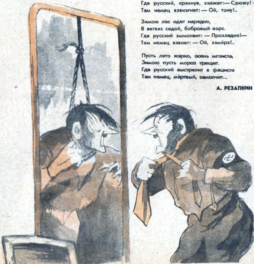
Ясно, как в зеркале.