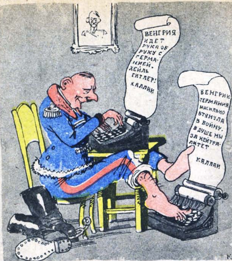
Сеанс одновременной игры.