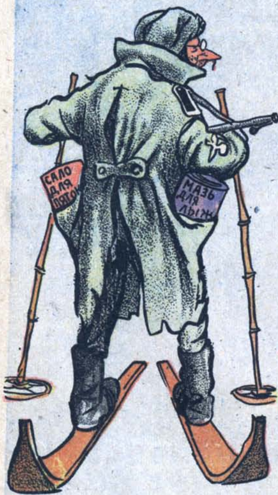
Фриц подготовился к лыжному сезону.