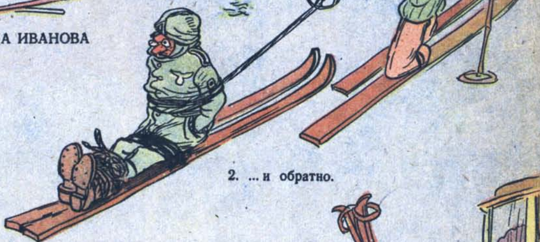
2. ... и обратно.