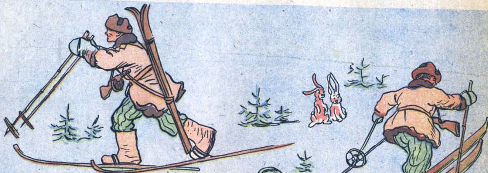
ЛЫЖНАЯ ПРОГУЛКА РАЗВЕДЧИКА ИВАНОВА 1. Туда...